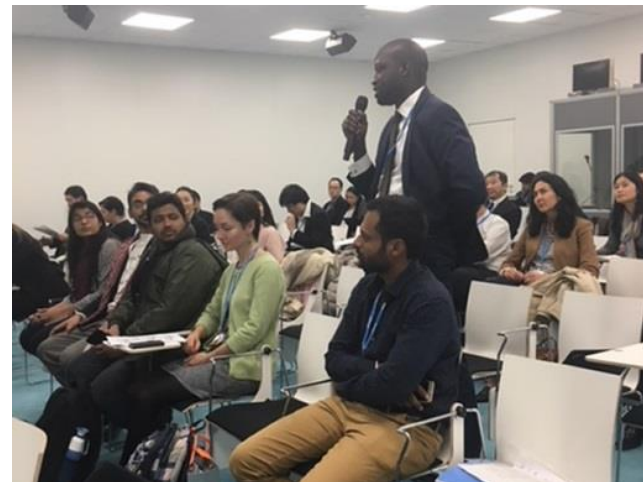
平成29年度事業におけるCOP23での様子

COP23ジャパンパビリオンのホームページ参照 http://copjapan.env.go.jp/cop23/event/nov15/03.html